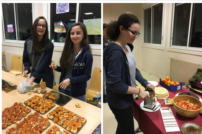
L'équipe de préparation du buffet s'active...

Le 25 janvier 2018, nous avons célébré au collège la soirée de l'amitié franco-bulgare, suite au voyage « Sur les traces des Thraces » effectué en novembre dernier par les élèves hellénistes de 3 ème .